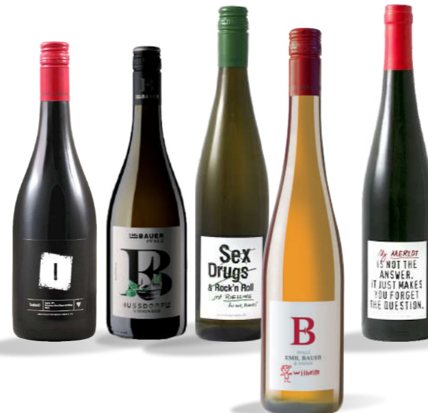
Allergiehinweis: Wein enthält Sulfite

2018 Chardonnay – trocken, 13,0 % Vol. Kernig-kühler Chardonnay in pfälzischer Stilistik, unterlegt von gelben Früchten und etwas Apfelaromatik. Nicht nur als Speisebegleiter perfekt. 0,75 l € 29,00