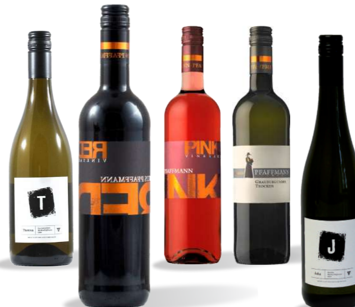
Allergiehinweis: Wein enthält Sulfite

Die frische, klare und feine Frucht der Weine reift nach dem Vergären in Edelstahlbehältern und hat nach dem Abfüllen in der Flasche noch Reifepotenzial. Diese schnörkellose und klare Stilistik bringt dem Weingut Jahr für Jahr eine Vielzahl an Auszeichnungen und Lob in den renommierten Weinführern ein. Insbesondere für trocken ausgebaute Rieslinge und Burgunder ist das Weingut schon lange bekannt. Seit einigen Jahren sind aber auch Rotweine und Newcomer wie Sauvignon Blanc in aller Munde.